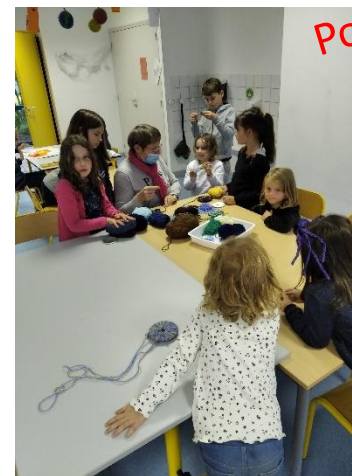
Pompon en laine